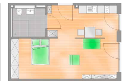
Wohnung 42 m 2