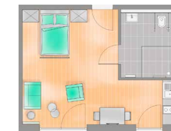
Wohnung 39 m 2