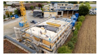
Das klimafreundliche Bauprojekt, das Gisela Raab betreut

Nach Ihren Erfahrungen mit dem Prototypen wollen Sie die Steck-Holzbausteine gleich bei zwei Häusern des Förder- und Forschungsprojekts „Kleiner Wohnen@Land“ in Redwitz an der Rodach im Landkreis Lichtenfels nehmen. Warum?