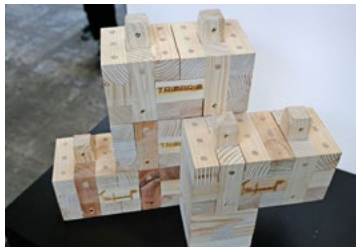
GiselSo sieht das Holzbausystem von „TRIQBRIQ“ aus

Bei Lehmbau arbeiten wir nur mit Wetterschutz beziehungsweise einem Zelt. Tragende Schichten und Wände eines Hauses werden unten in Ziegel angelegt, da sie nicht im Wasser stehen dürfen. Alle außen verwendeten Naturbaustoffe sind zügig zu verputzen beziehungsweise zu verschalen. Bei ihnen ist oft ein zusätzlicher Vollwärmeschutz nötig, was wir beispielsweise mit Strohdämmplatten planen.