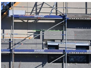
Raab sucht nach nachhaltigen Alternativen zu klassischer Außendämmung

Ganz wichtig ist dabei auch, wie und wann wir sie am Bau einsetzen oder wo wir sie notfalls zwischengelagern. Auf der Baustelle könnten manche Materialien beispielsweise bei einem heftigen Regenschauer leiden, obwohl sie am fertigen Bau, etwa im Innenraum, vor Nässe normalerweise geschützt sind. Die Lieferung und Lagerung der Baustoffe müssen wir deshalb ebenfalls optimal planen und handhaben.